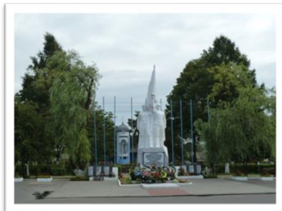
Фото 1. Площадь Свободы. Каплица Рождества Христова