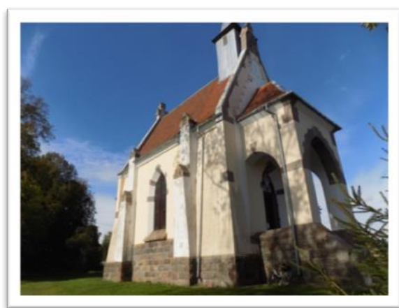
Фото 6. Агрогородок Вязынь. Католический храм Рождества Девы Марии.