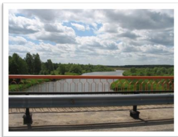
Фото 7. Город Вилейка. Река Вилия