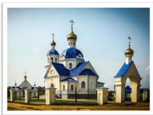
Фото 2. Город Вилейка. Храм Покрова Пресвятой Богородицы