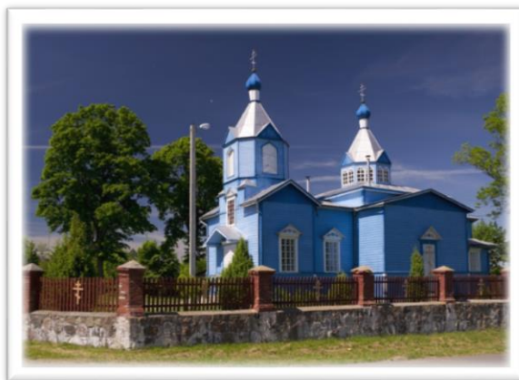
Фото 5. Агрогородок Вязынь. Храм Успения Пресвятой Богородицы