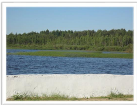
Фото 3. Вилейское водохранилище