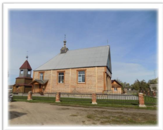
Фото 4. Агродорожок Илья. Храм Святого Пророка Илии